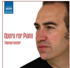
Opera for Piano NAXOS Best.-Nr.: 8.551062

Die CD's können direkt unter www.art-and-piano.de bestellt werden.