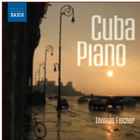
Cuba Piano NAXOS Best.-Nr.: 8.551297