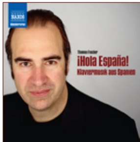
¡Hola España! NAXOS Best.-Nr.: 8.551209