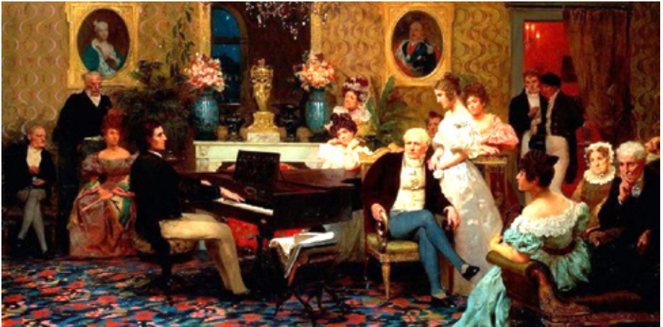
Salon in Berlin mit Chopin am Flügel